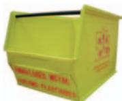
Bac à emballages en plastique et métal