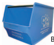
Bac à papier