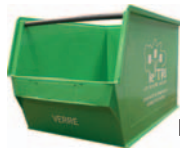
Bac à verre